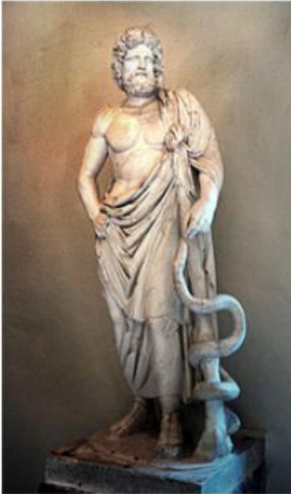
Tıp/sağlık tanrısı ASKLEPİOS-EPİONE